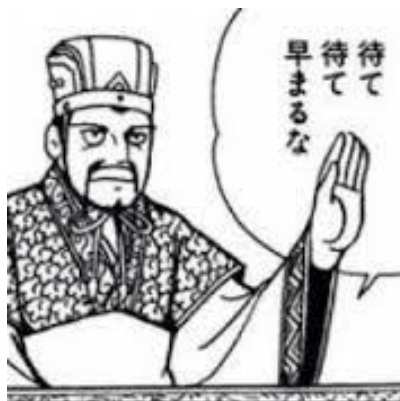
シバイ 司馬認先生も言っています。

以上の事に注意して頂き、何を選ぶにしてもまずは「インターネット」や「電話」を把握しているシステム担当と入念に打合せることが肝要です。