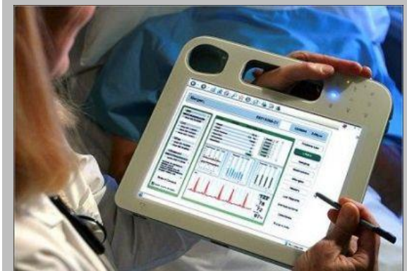
日本は電子カルテの普及もまだ2割程度

例えば患者が薬を処方するだけであれば、スマートフォンから病院へ処方依頼をすると、処方箋が患者の家の近くの薬局に送られてきます。患者はわざわざ薬をもらう為だけに病院へ行かなくても済むわけです。