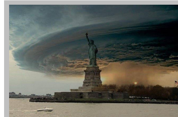
Facebookで62万回以上シェアされた 合成画像

日本国内ではデータセンターの大部分が東京圏に立地し、ITシステムの中核が一極集中している状況です。総務省では首都直下地震が起こった場合を想定し、地方のデータセンターへ分散することで、財産とも言うべき様々な情報を守る政策を打ち出しました。