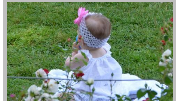
オランダは子供の幸福度で先進国 1位

日本のIT技術は、ゲームソフトや家電品、ロボット、検査装置など世界でもかなり高い水準の技術力と発想力を持っていると言えます。が、それらを一般企業や個人にまで落とし込み、身近なものをIT化していく IT活用 がIT先進国に比べるとかなり遅れています。オランダと韓国の事例を基に考えて行きましょう。