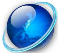
携帯電話会社の通信網

テザリングとは、携帯電話会社（au Softbank など）の通信網を利用して、パソコンやタブレット端末などをインターネットに接続する機能です。スマートフォン本体が無線LANルーターの親機として使えるようになりノートパソコンやタブレット端末を接続すると、自宅の無線LANルーターに接続しているのと同じように、屋外でもインターネットができるのです。