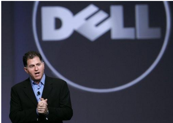
DELL 創業者 マイケル・デル最高経営責任者(CEO)

DELLの2012年第4四半期の数字を見ますと、デスクトップPCの売上高が前年同時期と比べて31億ドル 8.4%減 ノートPCに至っては35億ドルと25.8%の減少となっています。